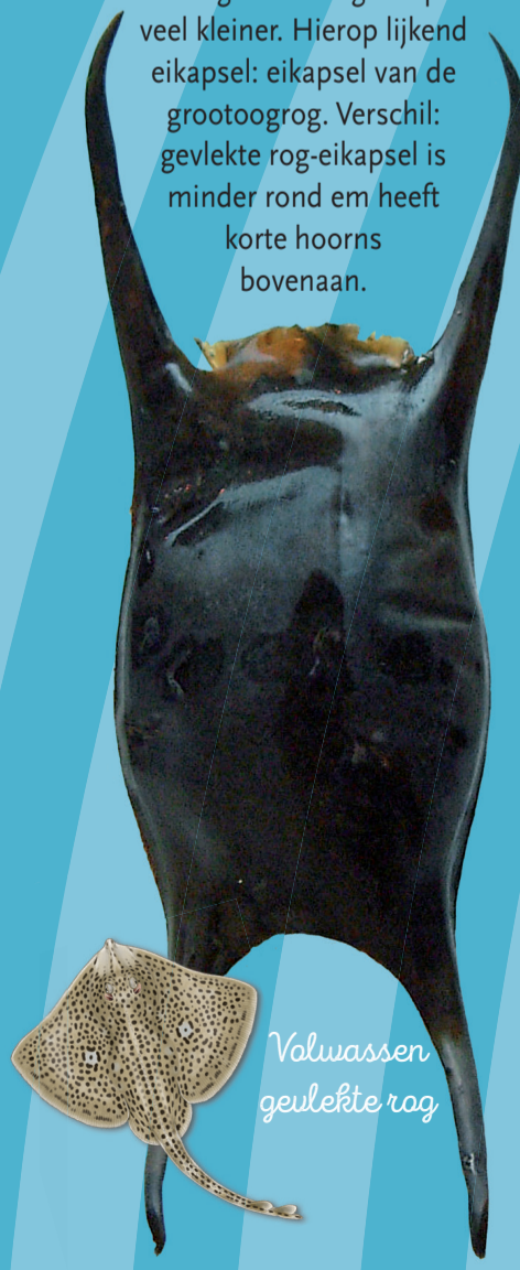
Volwassen gevlekte rog

GEVLEKTE ROG – Raja montagui Dooslengthe ongeveer 60mm. Geen zomen. Langs de Nederlandse en Belgische kust is deze rog minder algemeen. Hierop lijkend eikapsel: Golfrog-eikapsel. Verschil: gevlekte rog-eikapsel is veel kleiner. Hierop lijkend eikapsel: eikapsel van de grootoogrog. Verschil: gevlekte rog-eikapsel is minder rond en heeft korte hoorns bovenaan.