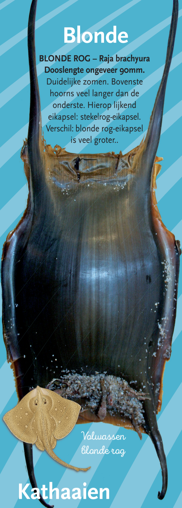
Volwassen blonde rog

BLONDE ROG – Raja brachyura Dooslengthe ongeveer 90mm. Duidelijke zomen. Bovenste hoorns veel langer dan de onderste. Hierop lijkend eikapsel: stekelrog-eikapsel. Verschil: blonde rog-eikapsel is veel groter..